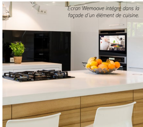
Écran Wemoove intégré dans la façade d'un élément de cuisine.