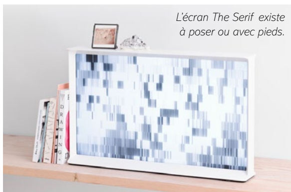
L'écran The Serif existe à poser ou avec pieds.

Toujours à la recherche de la touche parfaite pour votre intérieur ? Alors découvrez les écrans miroirs de Wemoove . Pour un salon, une chambre, une cuisine, une salle de bains... chez un particulier ou pour un projet d'architecture, un showroom... La start-up française Wemoove propose différentes solutions. « Les écrans miroirs s'intègrent jusque dans les portes de placards d'éléments hauts de cuisine », nous confie Grégory Legait.