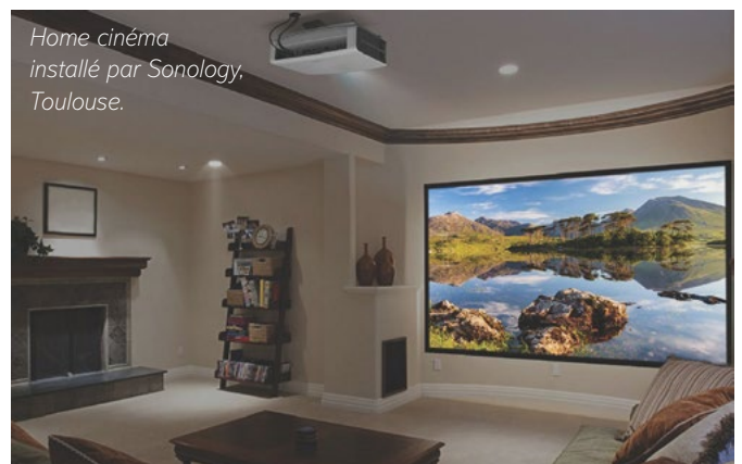
Home cinéma installé par Sonology, Toulouse.