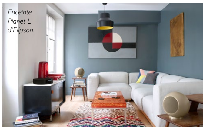
Enceinte Planet L d'Elipson.