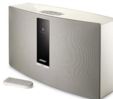
Enceinte sans fil SoundTouch 30 série III de Bose.

Côté hifi, la grande tendance, c'est le multiroom : la musique sans fil partout dans la maison. La même musique dans chaque pièce ou dissociées. Le cœur du système c'est la box, vous pilotez le tout avec votre téléphone portable ou votre tablette. Streaming, radio... vous diffusez ce qui vous plaît. Le système trouve toutes les musiques, où qu'elles se trouvent. Si vous stockez des MP3 sur votre ordinateur, votre téléphone pourra les jouer.