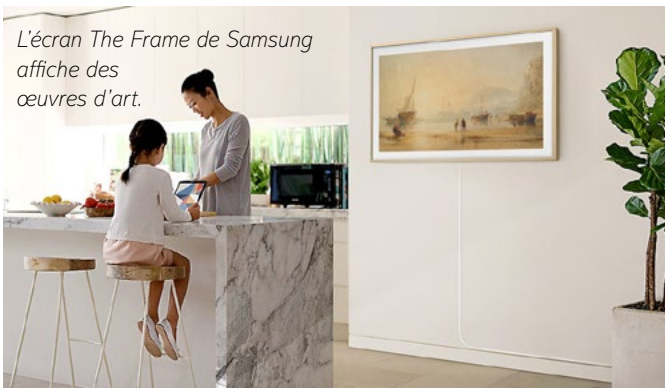
L'écran The Frame de Samsung affiche des œuvres d'art.