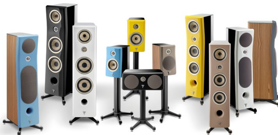
La collection d'enceintes Kanta de la marque Focal.